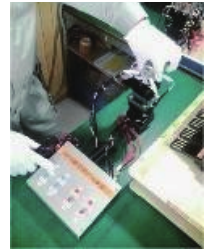
配線チェック治具